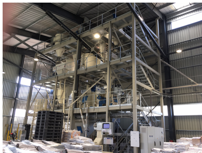
les mélangeurs et les silos d'ingrédients avant l'ensachage des farines dans le hangar n°1

Pour rendre possible la construction de ces trois bâtiments, la municipalité de Courcelles a procédé à une modification du Plan Local d'Urbanisme. Ceci dans le souci du développement du tissu économique de la commune, en accompagnant les projets d'agrandissements des entreprises.