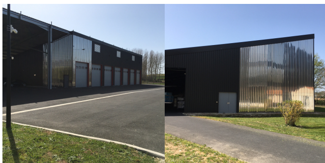
hangar n°3 abritant les véhicules de livraisons et d'approvisionnements et hangar n°2 du stockage des farines en sacs.

Avec une progression de 20 % du volume produit entre 2017 et 2018, et près de 5000 tonnes de farines livrées, la minoterie Méchain devait optimiser la fabrication de ses produits. Pour ce faire, ce sont dans un premier temps, trois nouveaux bâtiments d'une surface totale de 3200 m 2 qui sont sortis de terre en 2019. Accolé à «l'historique» moulin de 1912, déjà modernisé en 2010, c'est d'abord un hangar dédié à l'ensachage et à la palettisation automatiques qui a été créé. Un automate gère la fabrication des différentes farines, qui sont ensachées en sacs de 25 kg et stockées sur des racks ou chargées en vrac dans des camions citernes. Ce qui était ensaché hier en une matinée, est aujourd'hui palettisé en 1 heure. Les magasiniers n'ont plus à manipuler ces sacs de farine lourds à porter. En un siècle, le poids des sacs est passé de 120 kg à 100, puis à 80, à 50 à 40 et à 25 kgs. La machine a facilité le travail de l'homme, mais ne le lui a pas enlevé.