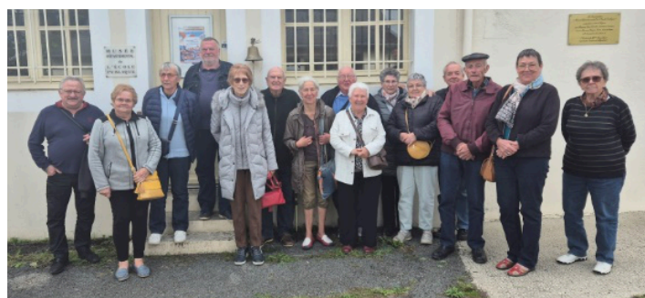
L'amicale populaire en visite au musée départemental de l'école Publique à Vergné